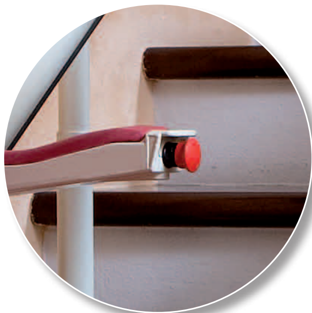
Bouton d'arrêt pour garantir l'arrêt immédiat