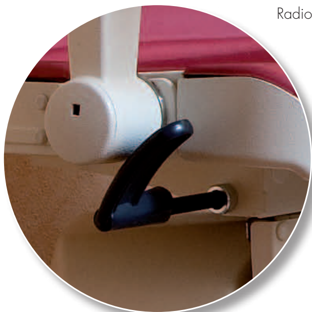
Levier de déblocage du siège