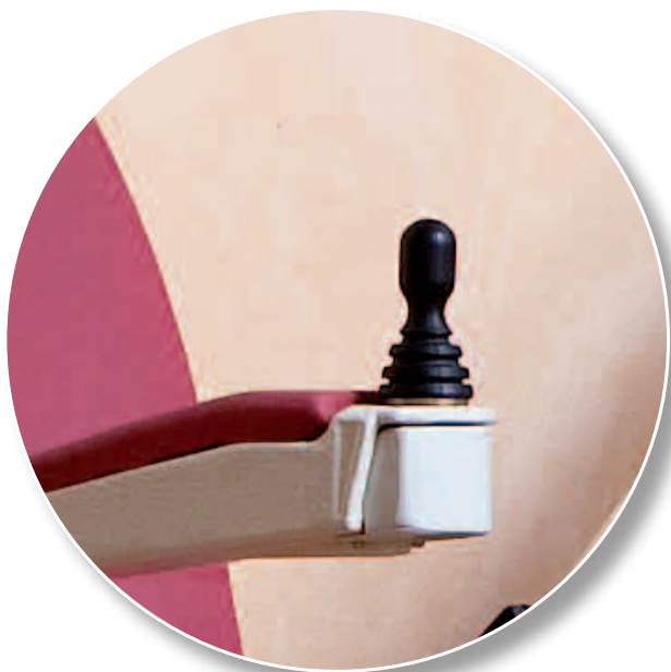
Manche pratique pour une utilisation facile et intuitive