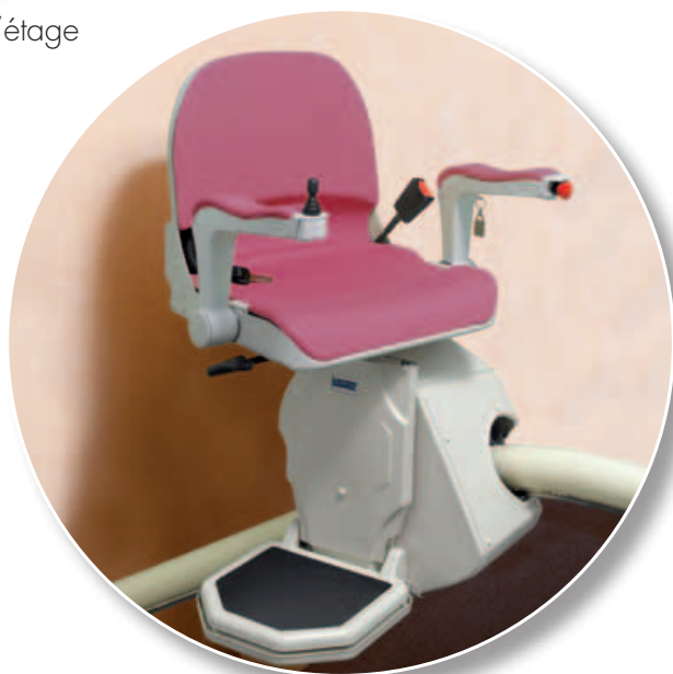
Rotation siège pour une descente confortable.