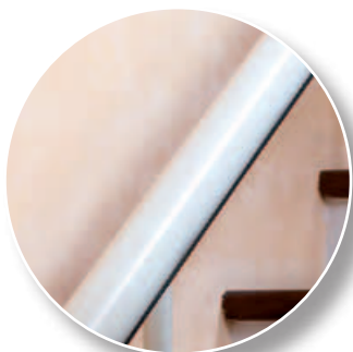
Ivoire (de série)