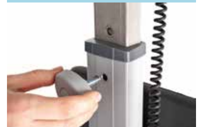
Regolazione altezza timone