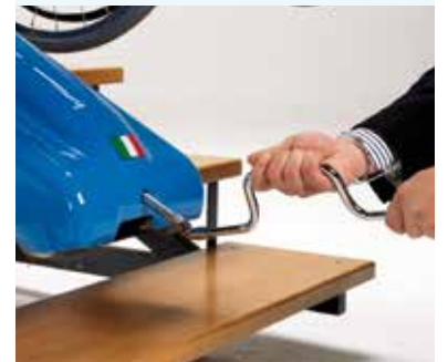
Utensile per manovra manuale