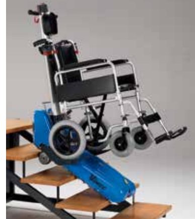
A.R.P. (Alloggiamento Ruote Piccole)