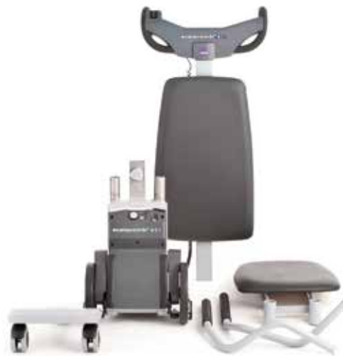
T10 smontato in 6 pezzi