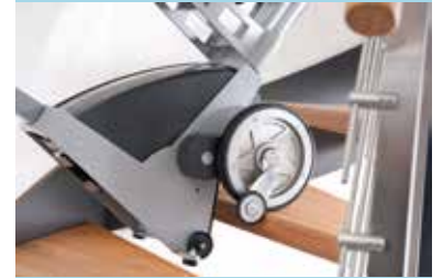
Meccanismo di stop al gradino