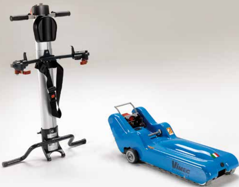
Timone self standing e corpo motore

Studiato e realizzato per superare scale rettilinee e con pianerottoli di forma quadrata/rettangolare in totale sicurezza e senza il rischio di rovinarle grazie alle peculiari caratteristiche dei cingoli che assicurano una elevata aderenza e non lasciano tracce.