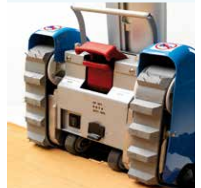
Doppio blocco, elettrico e meccanico, dell'aggancio