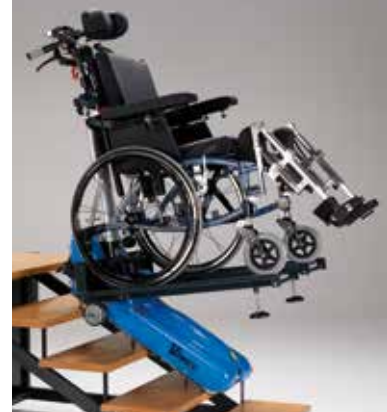
P.P. (Pedana Polifunzionale).