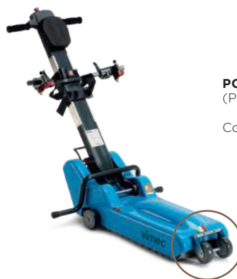
POWER (PORTATA 150 KG)

Con questa versione è possibile caricare la maggior parte delle carrozzine con ruote posteriori da 660 mm / 26 pollici (cod. ISO 12.21.06.039, 12.2106.60), sedute larghezza da 39 a 52 cm.