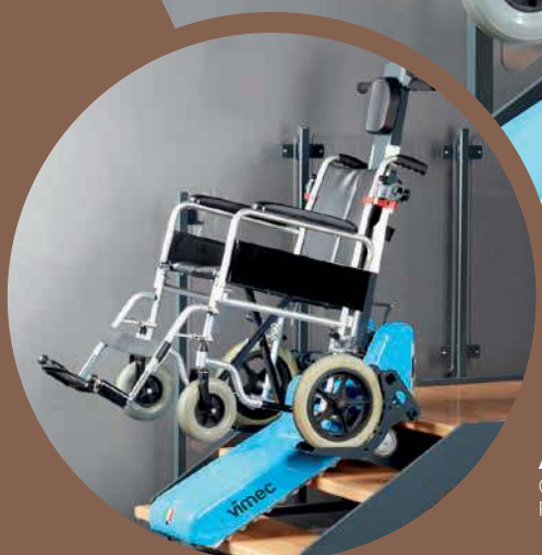
A.R.P. (ALLOGGIAMENTO RUOTE PICCOLE)