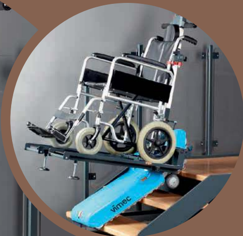
P.P. (PEDANA POLIFUNZIONALE)