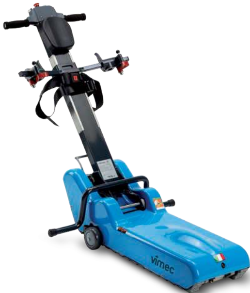
STANDARD (PORTATA 130 KG)