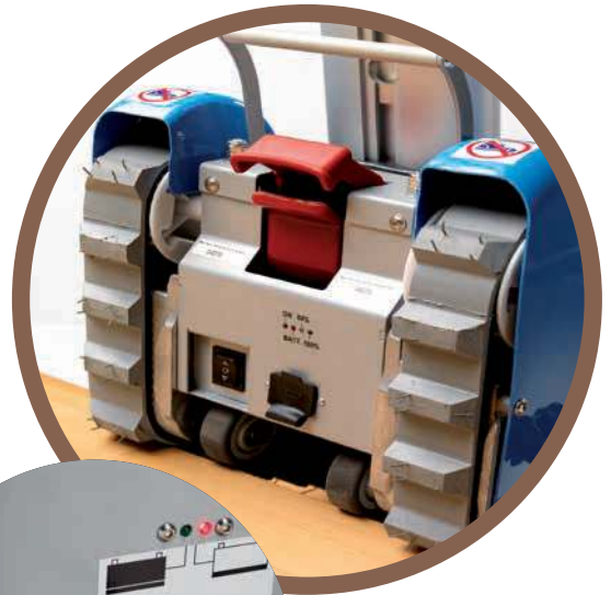
DOPPIO BLOCCO, ELETTRICO E MECCANICO, DELL'AGGANCIAMENTO TIMONE AL TRATTORE