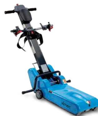
STANDARD (PORTATA 130 KG)

Con questa versione è possibile caricare la maggior parte delle carrozzine con ruote posteriori da 660 mm / 26 pollici (cod. ISO 12.21.06.039, 12.2106.60), sedute larghezza da 39 a 52 cm.