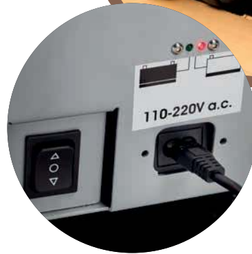
INDICATORE DI RICARICA BATTERIA E PULSANTE DI MOVIMENTAZIONE