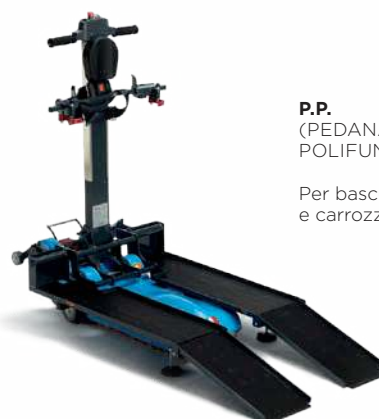
P.P. (PEDANA POLIFUNZIONALE)

Per bascule, seggioloni polifunzionali e carrozzine elettriche.