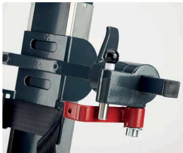
BLOCCHI AGGANCI SCHENALE CARROZZINA ORIENTABILI E REGOLABILI IN ALTEZZA E LARGHEZZA