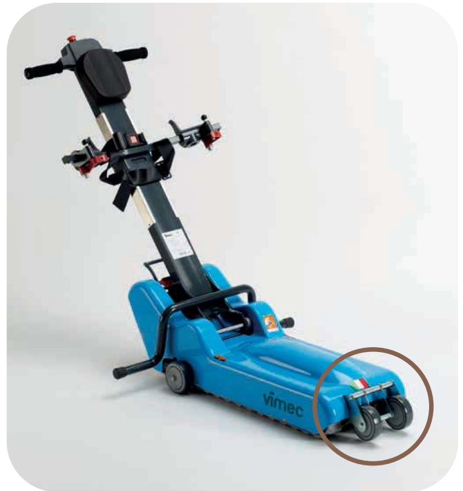
POWER (PORTATA 150 KG)