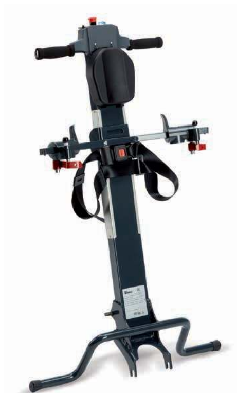
TIMONE SELF STANDING

Roby è certamente un prodotto di punta per tutte le ortopedie ed i negozi di articoli sanitari che forniscono prodotti all'avanguardia ai propri clienti.